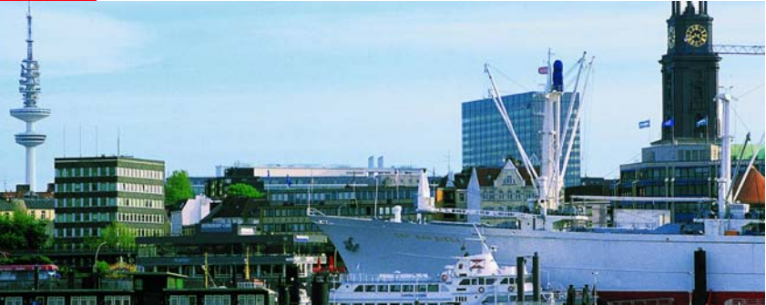
Hamburg, Blick über die Binnenalster auf den Michel

Der gebürtige Hamburger verfolgte auch eine Sportkarriere, die ihn zu einem erfolgreichen Zehnkämpfer machte. Er lebte in den 70er Jahren auf der Insel Grenada, für die er zeitweise als Sportminister tätig war. U.a. »Seewolf«.