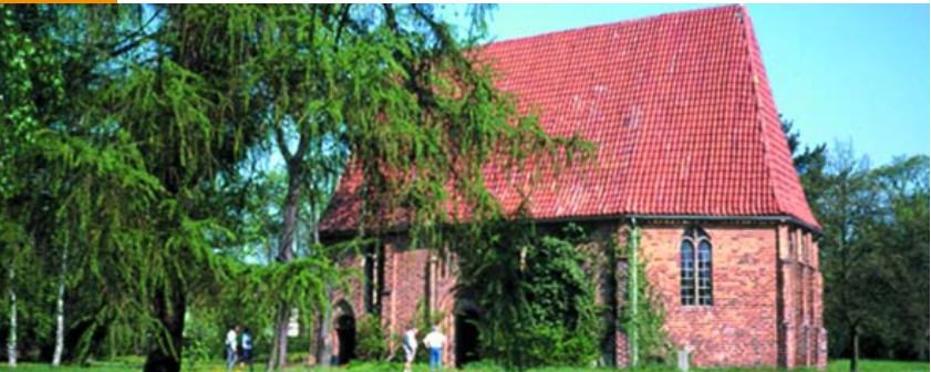
Die Gertrudenkapelle in Güstrow

Sie nannten sich »Vitalienbrüder« (lat. Viktualien: Lebensmittel). Der Name geht zurück auf die Zeit der dän.-meckl. Kriege um die schwedische Krone, in dem die Piraten das belagerte Stockholm mit Lebensmitteln versorgten.