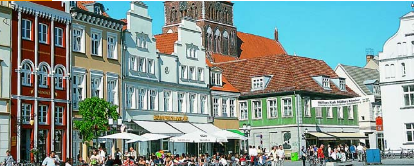
Greifswald – Geburtsstadt Caspar David Friedrichs

Am 5.9.1774 als Sohn eines Seifensieders in Greifswald geboren. Gilt heute als der bedeutendste Vertreter der deutschen Romantik.