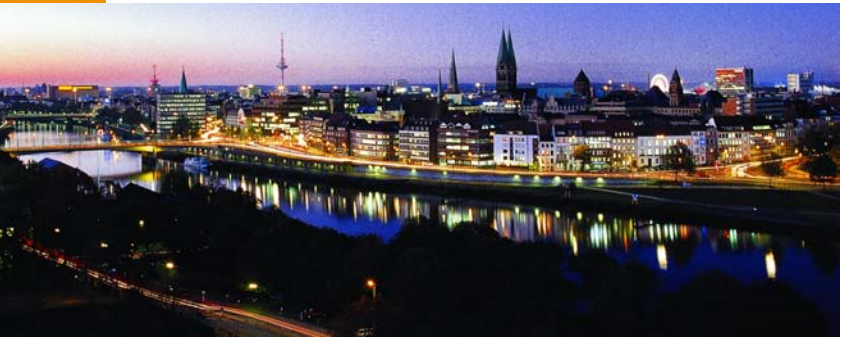
Bremen bei Nacht

Königin Margarete II. bestieg 1972, nach dem Tod ihres Vaters, den Thron der ältesten Monarchie Europas. Möglich gemacht hatte dieses eine Verfassungsänderung, die eine weibliche Thronfolge in direkter Linie erlaubte.