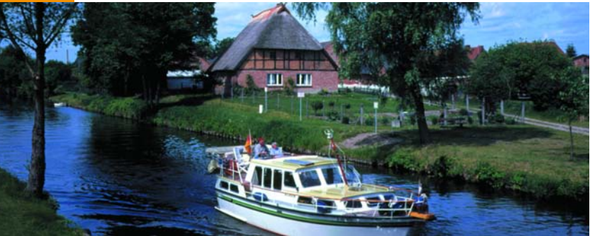
In der Heimat von Königin Luise

Der Schwede deutscher Herkunft gilt als einer der bedeutendsten Chemiker des 18. Jahrhunderts. Er entdeckte u.a. Chlor und Blausäure.